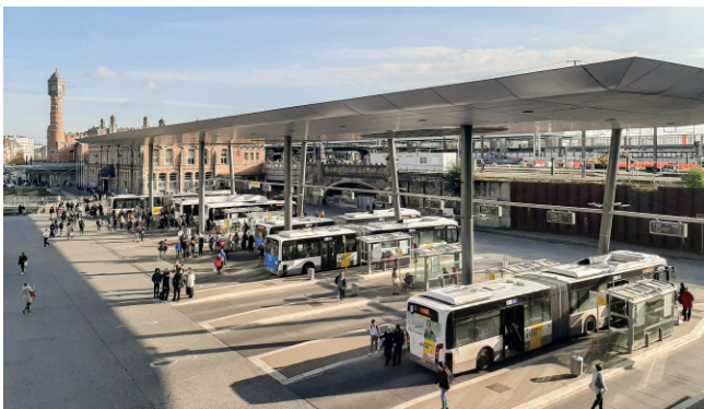
Moderne Fahrgastinformation an den wichtigsten Verkehrsknotenpunkten des Landes.

Die IVU baute hierfür ein Gesamtsystem für alle Betriebsregionen von De Lijn auf Basis des Leitstellen-systems IVU.fleet auf. Dieses sorgt für einen durchgängigen Datenfluss vom Fahrzeug zur Leitstelle und informiert die Disponenten stets über die aktuelle Verkehrslage und eventuelle Störungen. Umfangreiche Dispositionsfunktionen unterstützen die Disponenten dabei, Probleme schnell zu beheben, Anschlüsse zu sichern und das Bewegungsprofil aller Fahrzeuge zu erfassen.